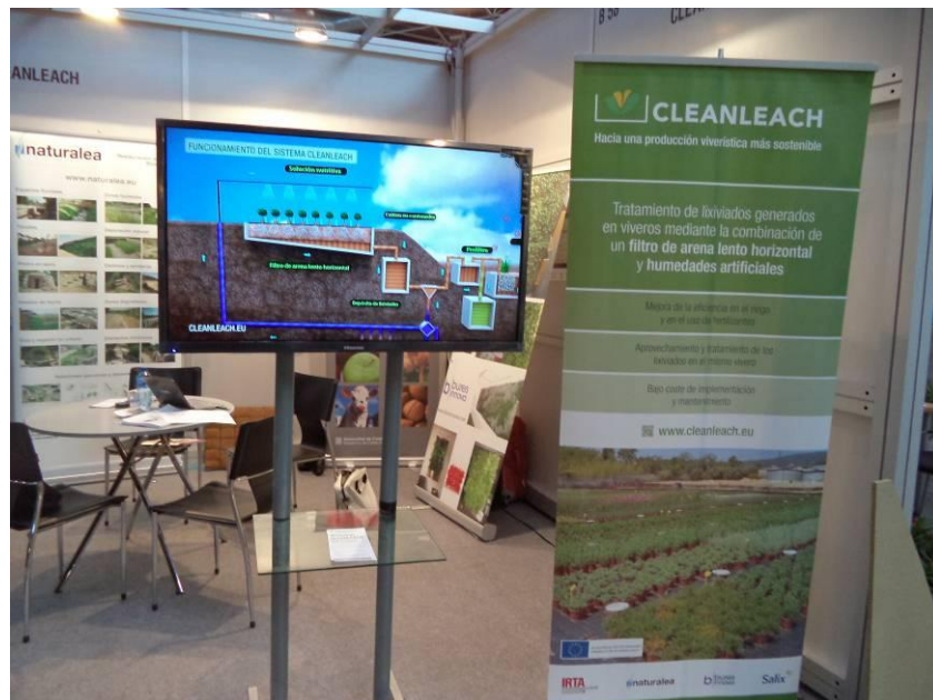
Iberflora trade fair (Valencia, Spain). 2014/10/1-3